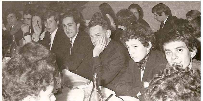
Entouré de ses élèves de terminale lors de la Fête de Ste Catherine le 25 novembre 1969

« Dans la lignée des Pères Jésuites, en l'adaptant à l'époque, nous avons essayé de former des hommes et des femmes responsables d'eux-mêmes et ouverts aux autres. Pour cela des structures particulières ont été instaurées : divisions par tranches d'âge avec éducateurs adaptés (et non simples surveillants) relations personnelles et confiance absolue entre jeunes et adultes, particulièrement entre chaque élève et le directeur (ce qui était dit par l'un ou par l'autre était considéré comme vrai même si les apparences étaient autres). Education au sens de l'effort par le sport pour tous et de l'autre par des activités relationnelles et caritatives.